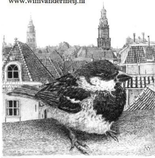
Ets - Mus in Zutphen - 12,5 x 15 cm