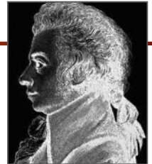
Zilverstifttekening door Doris Stock, april 1789