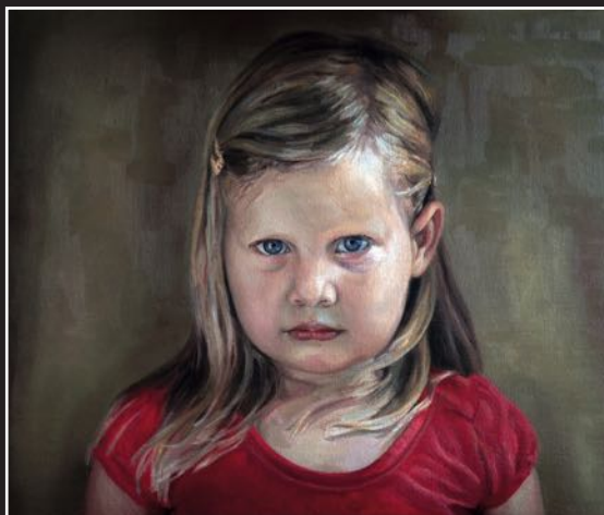
"Lara" - olieverf op linnen, 25 x 30 cm